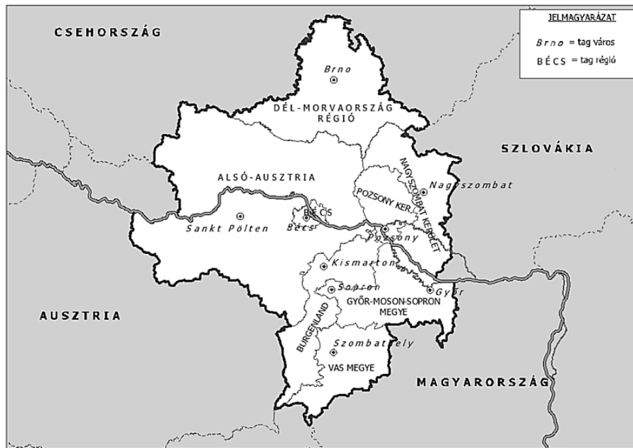
Figure 1: Centrope partner regions and cities